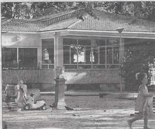
La antigua biblioteca del Cantón es utilizada ahora como Casa del Ajedrez

En nuestra comarca existen otros clubes que fomentan la práctica del ajedrez, como es el caso de Capablanca, Santa María de Caranza o Canido, también con gran nivel.