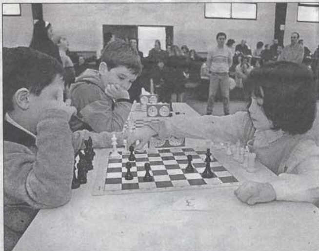
Los torneos escolares están experimentando un aumento espectacular en toda la comarca