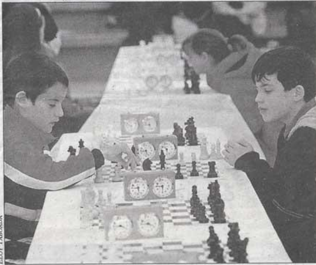
En los torneos y campeonatos se llegan a disputar más de treinta partidas a la vez