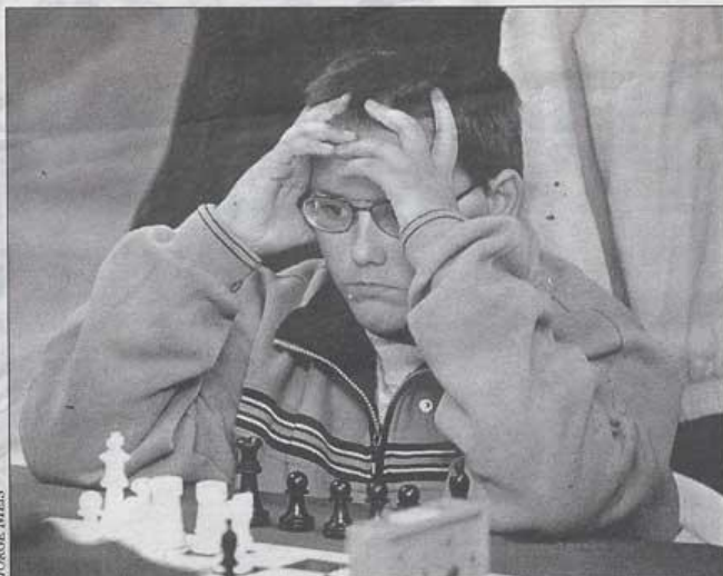
La concentración es uno de los factores fundamentales para conseguir buenos resultados

El Círculo Ferrolán de Xadrez es la entidad más antigua de la comunidad autónoma